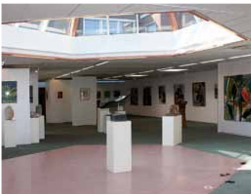
Interieur P'Arts Galerie