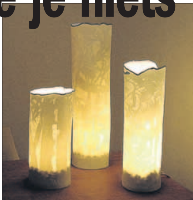
Porseleinen lampen van Diederik en Wied Heyning.

door de natuur, en die staat altijd in verbinding met het licht", zegt De Raat. "Daardoor straalt mijn werk zuiverheid uit."